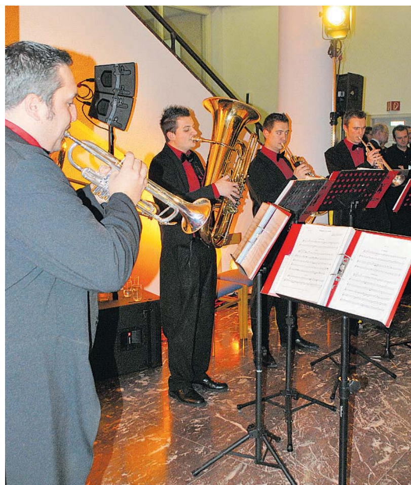
Das „Blechchaoten-Quintett“ aus Brücken bereicherte die Veranstaltung mit seinem Spiel.