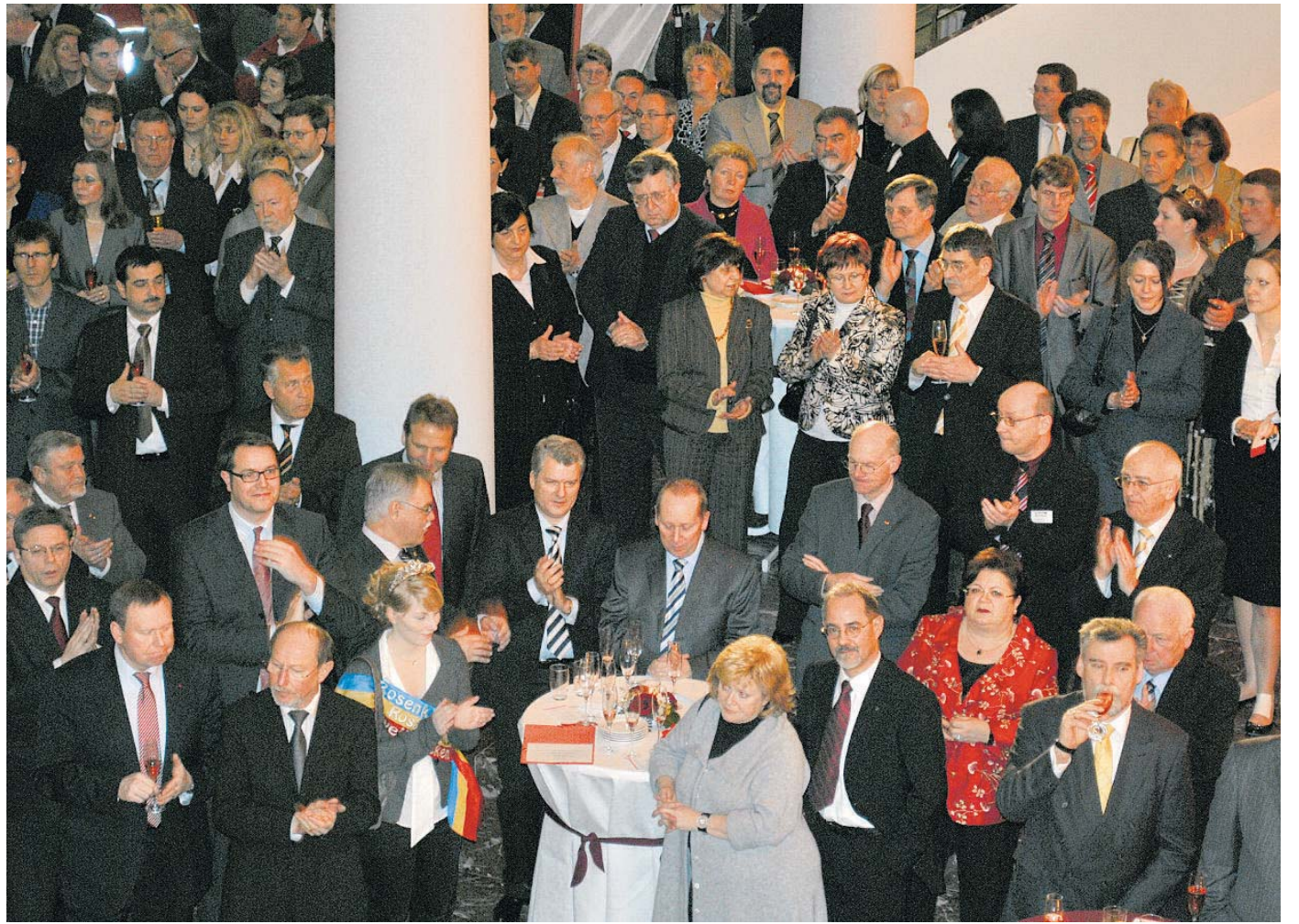
Über 300 Gäste verfolgten gebannt die gelungene Rede von Bundestagspräsident Norbert Lammert.